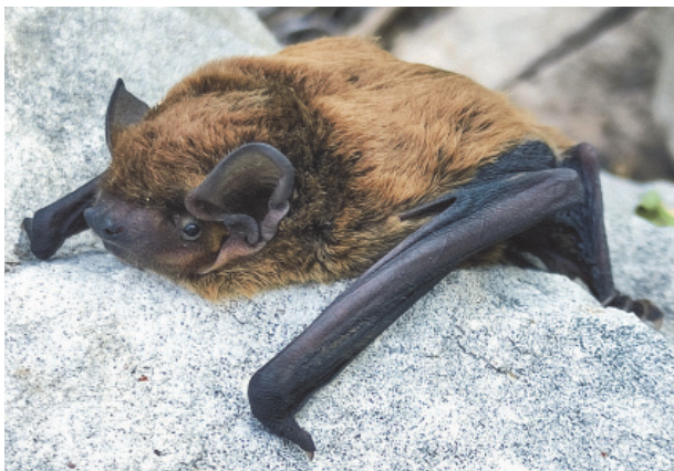
Рис. 4. Самка Nyctalus leisleri , отловленная на берегу пруда на ручье Шавец (Павловский кордон)

На кордоне Стекланный МГПЗ на берегу противопожарного копаного пруда 23 июля 2021 года был пойман один молодой самец малой вечерницы.