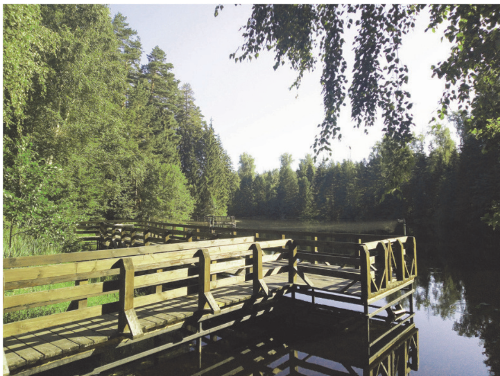
Рис. 5. Место отлова Nyctalus leisleri , пруд на ручье Шавец (Павловский кордон)

По литературным сведениям, бурый ушан был отмечен в заповеднике в четырех точках: угол кварталов 425 и 439, карьер в районе кордона