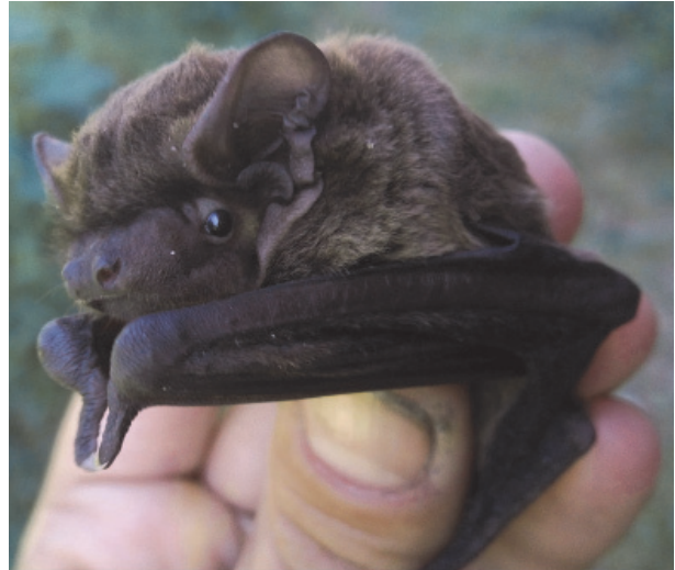
Рис. 2. Молодой самец Nyctalus leisleri , отловленный на песчаной косе на реке Мокша (окрестности Таратинского кордона)

На Павловском кордоне МГПЗ 20 и 21 июля 2021 года на берегу пруда на ручье Шавец были отловлены два молодых самца малой вечерницы. На следующий год на этом же месте 28 июля была отловлена одна постлактирующая самка N. leisleri (рис. 4 и 5).