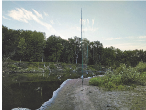
Рис. 3. Место отлова Nyctalus leisleri , песчаная коса на реке Мокша (окрестности Таратинского кордона)